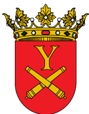
AYUNTAMIENTO DEL VALLE DE YERRI DEIERRIKO UDALA