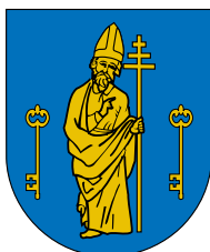
AYUNTAMIENTO DE LEZAUN LEZAUNGO UDALA